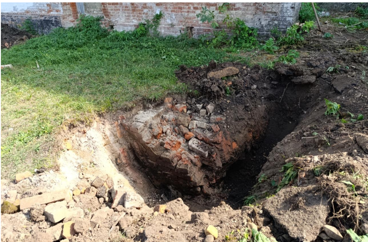
Фото 6. Вид на шурф 1. Видны остатки фундамента флигеля.