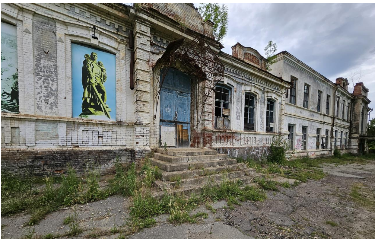
Фото 2. Вид на южный фасад всего объема здания-памятника, а также границы крыльца и балкона. Фото на северо-восток. Фото 2025 года.