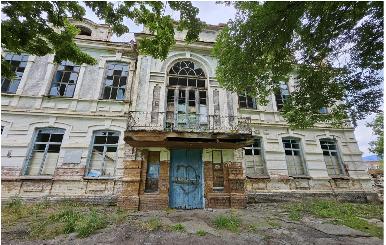
Фото 3. Вид на южный фасад здания-памятника и балкон, выступающий за утвержденные границы территории. Фото на север. Фото 2025 года.