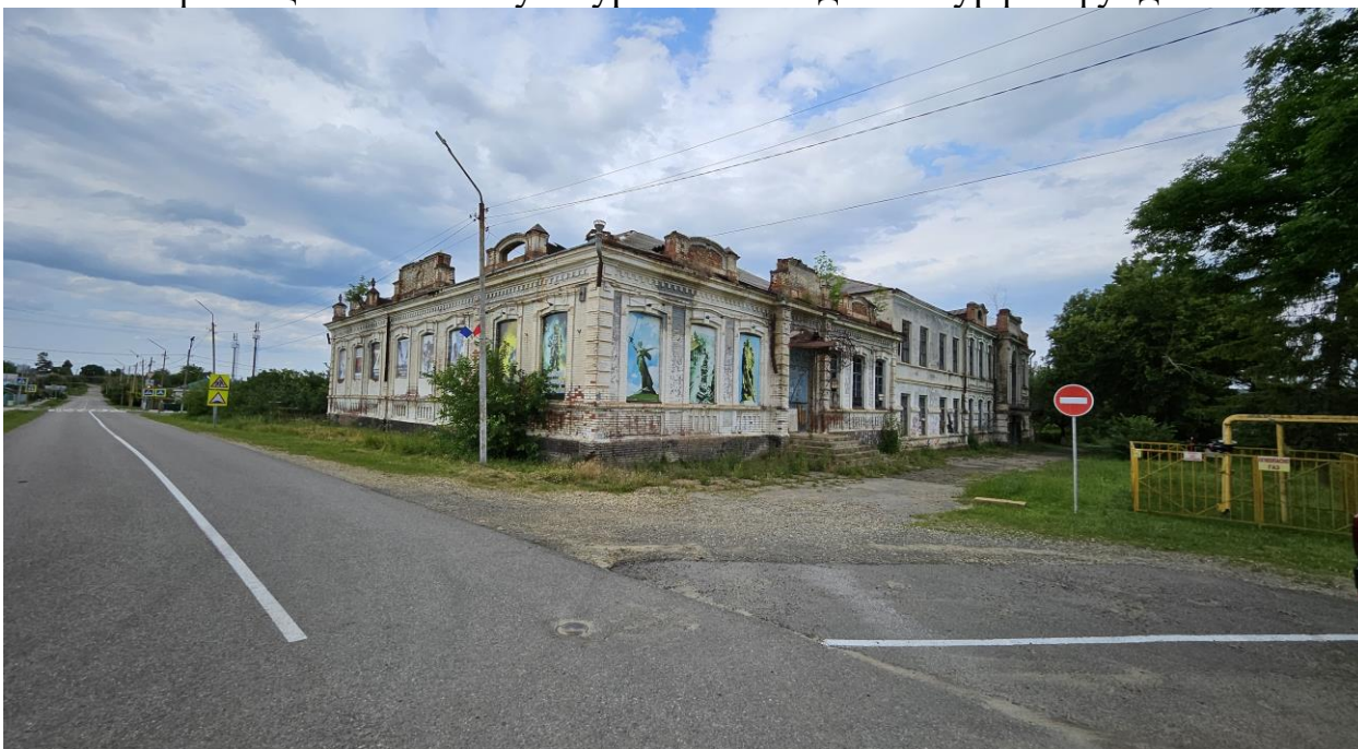
Фото 1. Вид на юго-западный угол и фасады здания-памятника с угла ул. Ленина и Школьной. Фото на северо-восток. Фото 2025 года.