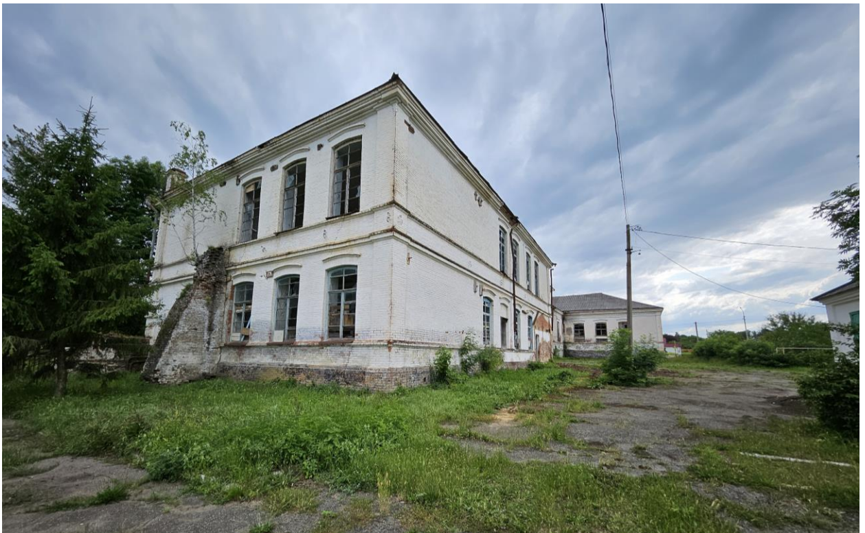
Фото 4. Вид на восточный фасад здания-памятника и подпорки. Фото на восток. Фото 2025 года.