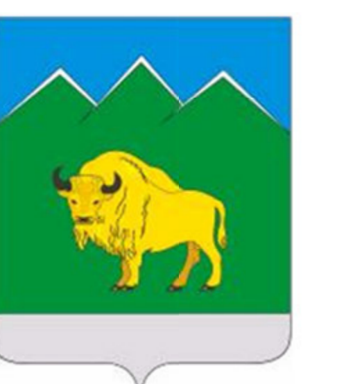
СХЕМА ТЕРРИТОРИАЛЬНОГО ПЛАНИРОВАНИЯ